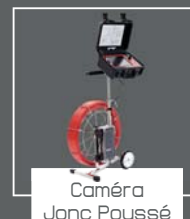
Caméra Jonc Poussé

Confirmation souhaitée avant le 22/09/2016 par email à webmaster@agriqpa-sa.com