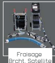
Fraisage Brcht. Satellite