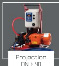
Projection DN > 40