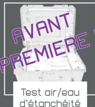
Test air/eau d'étanchéité