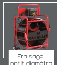
Fraisage petit diamètre