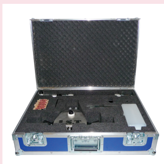
Valise de transport