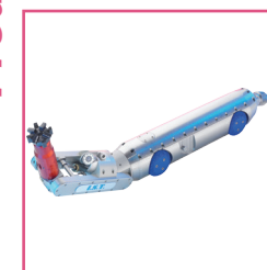
Power Cutter 200