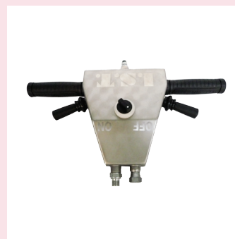
Volant de contrôle