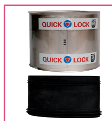
Quick Lock Extrémité de gainage