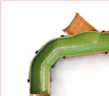
Gainage avec coude