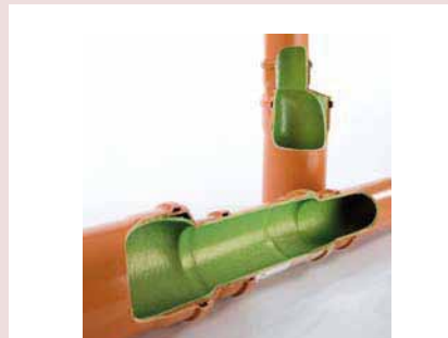
Gainage avec chapeau